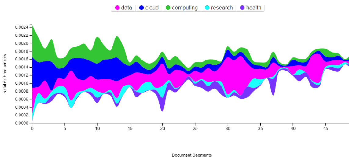
شکل ۵. خروجی ابزار استریم گراف

ابزار استریم گراف (Stream graph): مجموعه‌ای است که حاوی چندین سند است و ترتیب اسناد معنادار است (مانند ترتیب زمانی). همچنین می‌توان آن را با یک سند واحد که به‌طور خودکار بخش‌بندی می‌شود استفاده کرد. خروجی ابزار فوق در شکل ۵ آورده شده است.