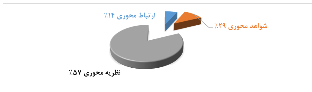
نمودار ۲. ملاک‌های شناسایی شده در ارزیابی کیفیت تبیین

همان‌طور که در جدول ۱ مشاهده می‌شود نشانگرهای ارزیابی کیفیت تبیین آورده شده است که از جمع نشانگرهای مرتبط، ۳ ملاک اصلی استخراج شد که ملاک نظریه محوری، بیشترین تعداد نشانگر (۸ نشانگر) را در بین ملاک‌ها داشت. در نمودار ۲، درصد متناظر با تعداد نشانگرهای مرتبط با هر یک از ملاک‌های شناسایی شده نشان داده شده است.