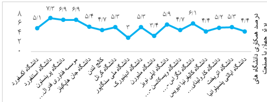
نمودار ۲. درصد همکاری دانشگاه‌های کشورهای برتر جهان با صنعت

یافته‌ها نشان می‌دهد بر اساس اطلاعات به دست آمده از فعالیت‌های دانشگاه‌ها با صنعت در کشورهای توسعه یافته به طور کلی بهترین عملکرد مربوط به دانشگاه استنفورد با ۷/۳٪ و پس از آن دانشگاه پرینستون و زوریخ به طور مساوی با ۶/۹٪ همکاری، دانشگاه تگزاس با ۶/۱٪ همکاری، دانشگاه ایلینویز با ۵/۹٪، دانشگاه جان هاپکینز با ۵/۴٪، دانشگاه کرنل، ادینبورگ و اوتریخت با ۵/۳٪، دانشگاه