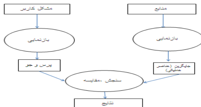
تصویر ۳. دیدگاه سنتی از روند بازیابی اطلاعات

ارزیابی عملکرد بازیابی اطلاعات علمی مبتنی بر نتایج یافته‌ها معمولاً به شکل کمی صورت می‌گیرد؛ بنابراین ارزیابی سنتی از قضاوت مبتنی بر مقایسه نتایج فراگیر در مقابل معیار عملکردی مشخص شده تشکیل می‌شود. شرایط واقعی اغلب غیرقطعی و نامعلوم هستند و نمی‌توان آن‌ها را کاملاً دقیق توصیف کرد. دیدگاه سنتی ارزیابی عملکرد با هدف ارزیابی، قضاوت و یادآوری عملکرد است (تصویر ۳)؛ در حالی که در دیدگاه مدرن، فلسفه ارزیابی بر رشد، توسعه و بهبود ظرفیت ارزیابی شونده متمرکز شده است (۲۱). در این راستا ارزیابی کمی دچار نقص‌هایی بوده و قادر به ارائه نتایج واقعی نیست.