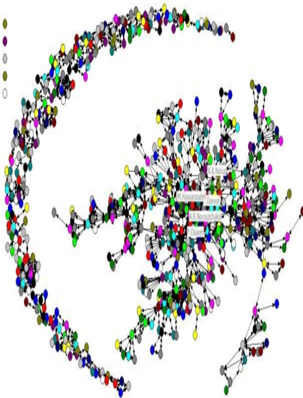
تصویر ۱. شبکه هم‌تالیفی پژوهشگران حوزه‌ی اطلاع‌سنجی

در این مطالعه اندازه گره‌ها، مرکزیت درجه یا تعداد هم‌تالیفی آن گره و قطر پیوندهای موجود میان گره‌ها نشان دهنده تعداد تالیفات مشترک آن دو گره با یکدیگر است. نتایج پژوهش نشان می‌دهد که شبکه هم‌تالیفی پژوهشگران حوزه‌ی اطلاع‌سنجی از تعداد ۶۹۷ گره و ۲۵۵۷ پیوند تشکیل شده است (تصویر ۱). همچنین پنج نویسنده دارای بیشترین تولید در تصویر شماره ۱ مشخص شده‌اند.