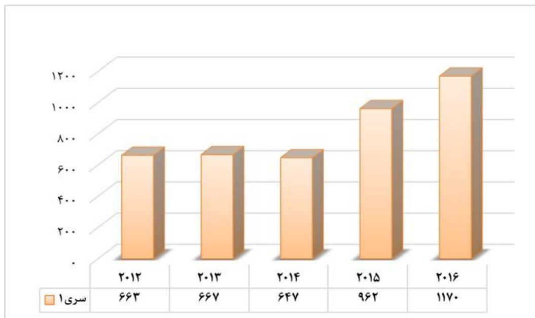
نمودار ۱. روند رشد تولیدات علمی دانشگاه علوم پزشکی شیراز در نمایه استنادی وب‌آوساینس

نمودار ۱، روند رشد تولیدات علمی دانشگاه علوم پزشکی شیراز را در نمایه استنادی وب‌آوساینس نشان می‌دهد. به طور کلی در این دوره پنج ساله، ۴۱۰۹ مدرک توسط پژوهشگران دانشگاه علوم پزشکی شیراز در پایگاه استنادی وب‌آوساینس نمایه شده که از این تعداد، بیشترین سهم تولیدات علمی این دانشگاه مربوط به سال ۲۰۱۶ با ۱۱۷۰ مدرک است (نرخ رشد ۱۴/۸۱٪) و کمترین سهم مربوط به سال ۲۰۱۴ با ۶۴۷ مدرک می‌باشد.