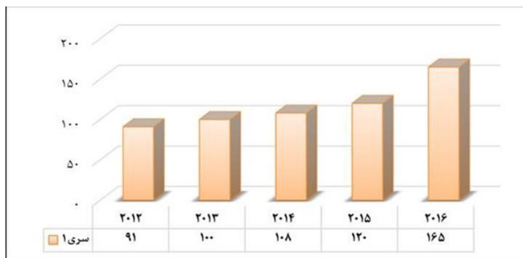
نمودار ۲. روند رشد تولیدات علمی با همکاری بین‌المللی دانشگاه علوم پزشکی شیراز

در نمودار ۲، روند رشد تولیدات علمی مشارکتی بین‌المللی دانشگاه مذکور قابل مشاهده است. بررسی اطلاعات استخراج شده نشان داد، ۵۸۴ مدرک با مشارکت پژوهشگران خارجی انجام شده است و همان‌طور که ملاحظه می‌شود تولیدات مشارکتی این دانشگاه در طی سال‌های مختلف روندی افزایشی و رو به رشد داشته است؛ به طوری که کمترین میزان تولیدات مربوط به سال ۲۰۱۲ با ۹۱ مدرک و بیشترین میزان تولیدات مربوط به سال ۲۰۱۶ با ۱۶۵ مدرک می‌باشد.